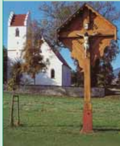
Die Fronhofer Kirche in Wehingen

Warum spricht man von der „Rettung für die Fronhofer Kirche“? Wo liegt das Problem? Nun - südlich der Kirche und des Friedhofs ist eine wasserreiche Quellschicht. Dieses Wasser kommt nicht nur in einer Quellschüttung an die Oberfläche, sondern fließt auch im Untergrund gegen die Fundamente der Fronhofer Kirche. Das Wasser steigt in den Wänden hoch und zermürt sie, wie man außen und innen sehen kann.