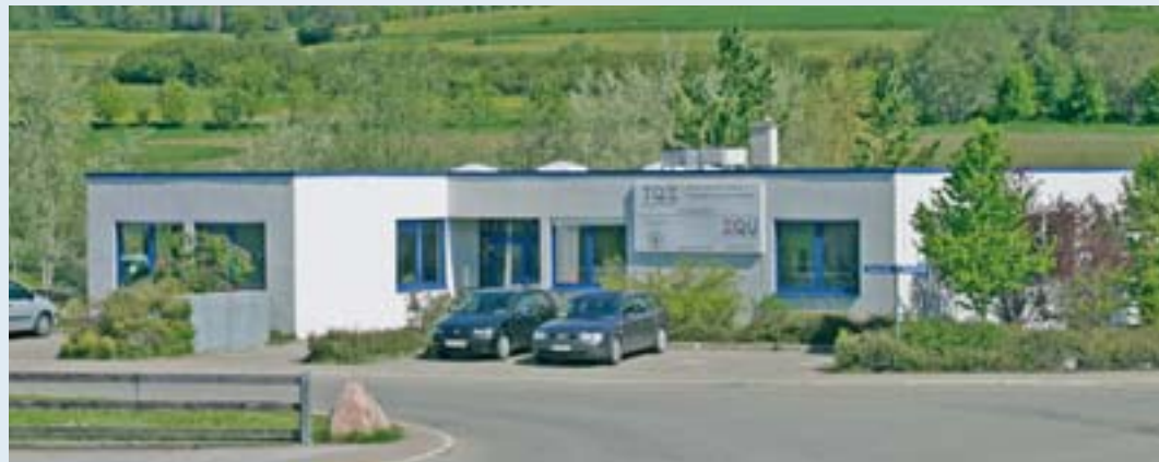
Unternehmer und Führungskräfte stehen im Steinbeis-Transfer-Institut Gosheim kurz vor ihrer Abschlussprüfung.

Am Steinbeis-Transfer-Institut Innovation, Qualität und Unternehmensführung (IQU) der Steinbeis-Hochschule in Gosheim studieren Eigentümer von kleinen und mittelständischen Unternehmen mit Nachfolgern und künftigen Führungskräften