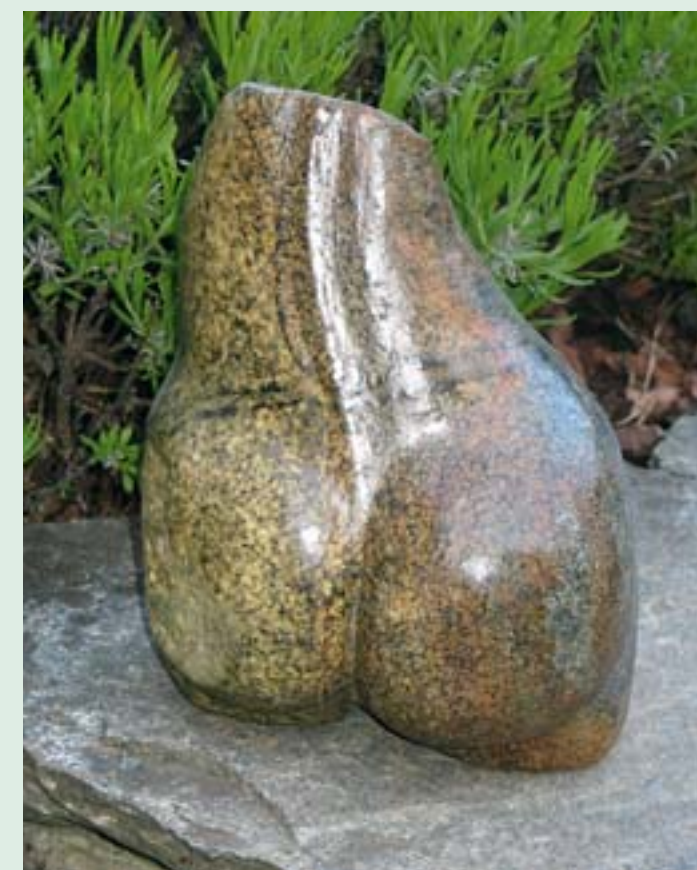
Ein hübscher Rücken kann auch entzücken - frei nach diesem Satzung schuf Dieter Wangler dieses Werk. In seinem Kunstgarten stehen noch einige andere interessante Arbeiten.