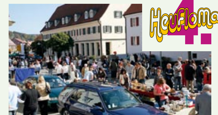
Großer Heuberger Flohmarkt im gesamten Wehinger Ortszentrum, Infos unter www.heuberg-aktiv.de