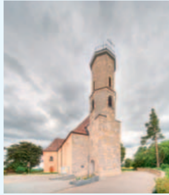
Wallfahrtskirche mit Claretiner Missionshaus

Der Männergesangsverein „Harmonie“ Obernheim lädt am Samstag, 16. April um 17 Uhr zu einer Stunde der Besinnlichkeit in vorösterlicher Zeit in die Wallfahrtskirche auf dem Dreifaltigkeitsberg ein.