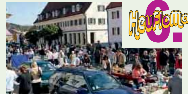
Großer Heubeger Flohmarkt im gesamten Wehinger Ortszentrum, Infos unter www.heuberg-aktiv.de