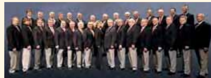
Die Menvoices (links) haben am Samstag, den 22. Oktober 2011, den bekannten Schiedsrichterchor Zollernalb (rechts) zu Gast.