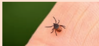
Zeckenweibchen vor und nach dem Stich

Die Borreliose ist eine durch das Bakterium Borrelia burgdorferi ausgelöste Infektionskrankheit. Die Bakterien können bei Infizierten jedes Organ, das Nervensystem und die Gelenke sowie das Gewebe befallen. Sie ist die häufigste durch Zecken übertragene Erkrankung in Deutschland. Wie viele Menschen in Deutschland daran erkranken, ist schwer zu bestimmen. Man schätzt die Zahl auf mehrere Zehntausend. Gegen Borreliose gibt es keine Impfung. Es muss im Falle einer Infektion vom Arzt ein Antibiotikum verschrieben werden.