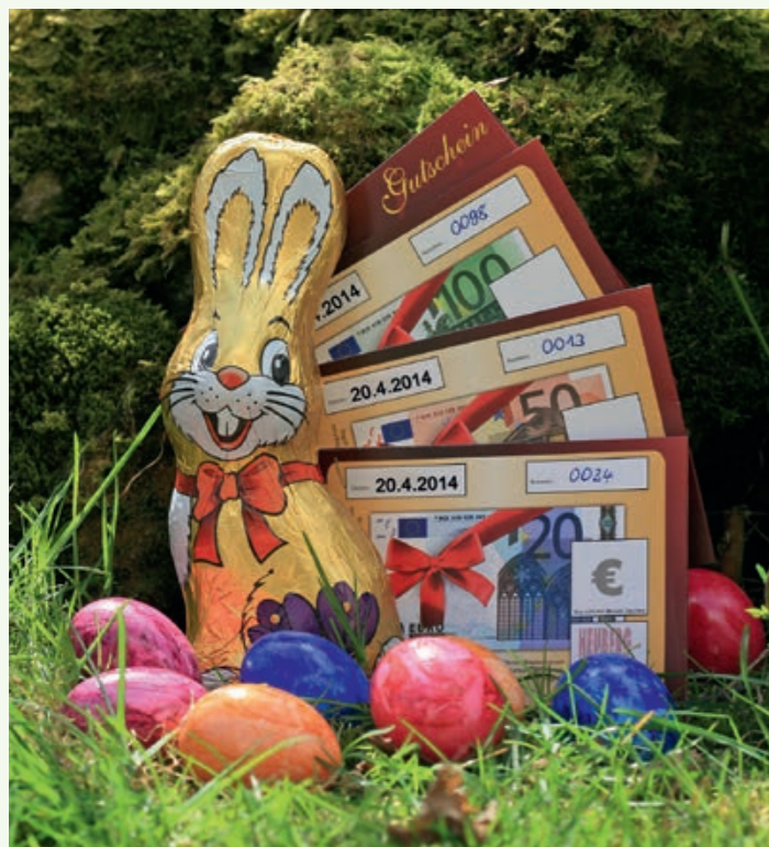
Elegante Heuberg aktiv-Geschenkgutscheine. Eine Auflistung der Heuberger Fachgeschäfte ist beigefügt.

Nur noch wenige Tage bis Ostern. Haben Sie für Ihre Lieben schon ein passendes Geschenk gefunden? Nein? Wie wäre es denn mit einem Geschenkgutschein aus Ihrer Heubergregion?