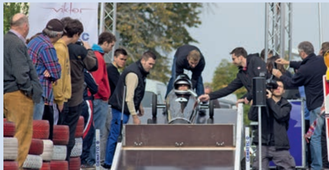
Am Sonntag, 28. September, herrscht wieder Rennfieber in Gosheim: Das achte Seifenkistenrennen wird dann in der Ortsmitte wieder über die Bühne gehen – diesmal in insgesamt zehn Rennklassen.

Achte Auflage des Gosheimer Seifenkistenrennens startet am 28. September