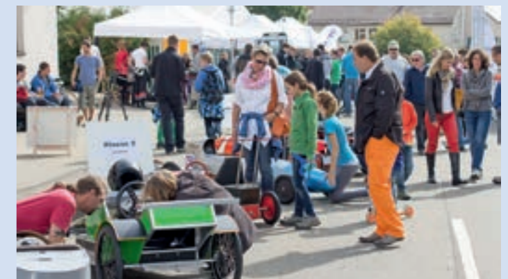
Rennfieber in der Boxengasse: Beim Gosheimer Seifenkistenrennen sind Fahrzeuge der unterschiedlichsten Kategorien am Start.

Dabei sind nicht nur eine große Fahrzeugvielfalt, sondern auch verschiedenste Rennteilnehmer: Von der achtjährigen „Profi“-Starterin in der Junior-Klasse BW bis hin zum gestandenen Feuerwehrmann stürzen sich die unterschiedlichsten Menschen mit Karacho auf die Asphalt-piste.