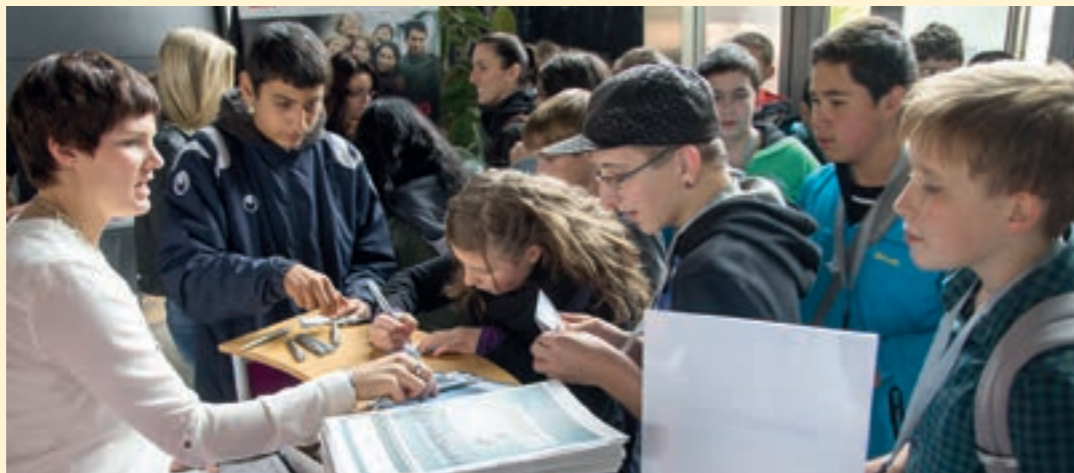
Publikumsmagnet Berufetag: Über 200 Jugendliche und ihre Begleitung waren 2013 dabei.

Rund 7.000 Arbeitsplätze in etwa 800 Unternehmen bietet die regionale Branche, die für namhafte Kunden in aller Welt produziert und für ihren hohen Qualitätsstandard bekannt ist. Logisch, dass diese Arbeitsplätze als zukunftssicher gelten.