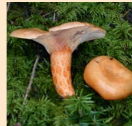
Lachsreizker: Essbar wie alle orange milchenden Reizker

tannen). Besonders lecker, aber seltener ist der Edelreizker (unter Kiefern). Tipp: Scharf in Fett anbraten, dann schmecken sie besonders gut.