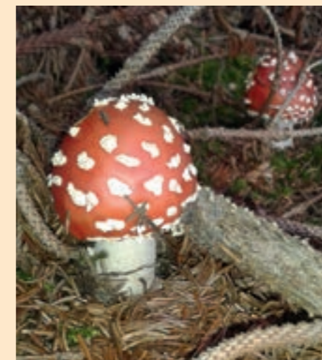
Fliegenpilz: hübsch anzusehen, aber sehr giftig

Fliegenpilz: „Magic Mushroom“ mit üblen Nebenwirkungen In der Drogenszene sind „Magic Mushrooms“ (magische Pilze) beliebt, sprich Pilze mit berauschender Wirkung. Dazu gehört auch der Fliegenpilz, der deswegen bei manchen Naturvölkern hoch im Kurs stand. Die Sache hat nur einen Haken: Er verursacht schwerste Vergiftungen mit Durchfall, Erbrechen und Schweißausbrüchen. Grund genug also, bei diesem Pilz an einen Verzehr nicht einmal zu denken! Unbeschwert genießen können Sie dagegen seinen hübschen Anblick, der sich in vielen Heuberger Wäldern bietet.