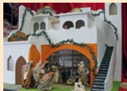
Bei den vergangenen Ausstellungen gab es eine Menge zu bestaunen.