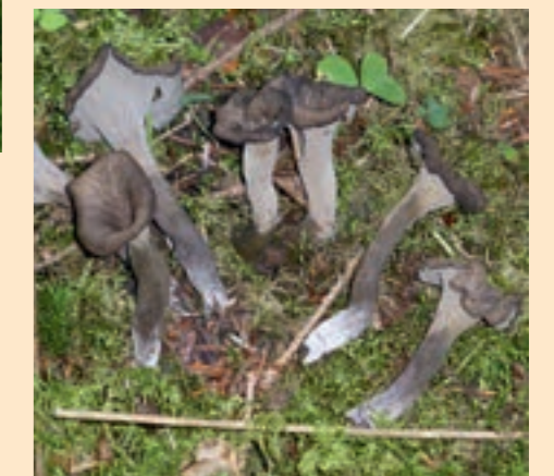
Herbsttrompete: triste Farben, aber feiner Geschmack

Herbsttrompete: Fast so lecker wie der Pfifferling Jeder kennt den goldgelben Pfifferling, aber seinen schwarz-grauen Verwandten kennt kaum jemand. Dabei ist die ebenfalls zur Familie der Leistikos gehörende Herbsttrompete fast genauso lecker! Wegen ihrer tristen Farben wird sie oft auch „Totentrompete“ genannt. Sie ist aber nicht giftig, sondern sehr wohlschmeckend. Ein vorzüglicher Pilz, um Soßen zu verfeinern – auch für Pilzsammler mit wenig Erfahrung.