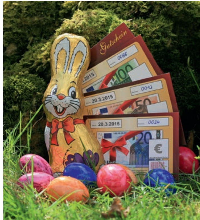
Elegante Heuberg aktiv-Geschenkgutscheine. Eine Auflistung der Heuberger Fachgeschäfte ist beigefügt.

Nur noch wenige Tage bis Ostern. Haben Sie für Ihre Lieben schon ein passendes Geschenk gefunden? Nein? Wie wäre es denn mit einem Geschenkgutschein aus Ihrer Heubergregion?