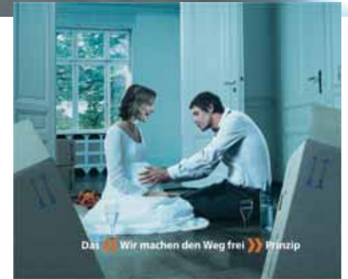
Das « Wir machen den Weg frei » Prinzip

Auskünfte erhalten Sie bei der Firma Paul Hermle GmbH, Gosheim.