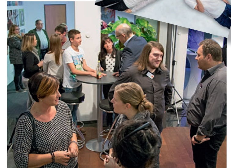
KMS kennenlernen und zu Ausbildungschancen ins Gespräch kommen, das ging bei der "Azubizeit" der Kommunikationsagentur.