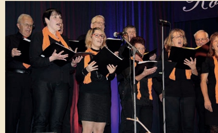
Konzert am 31. Oktober 2015

Im kommenden Jahr will sich der Chor auf die neue Festhalle, die gerade im Entstehen ist und ein Musentempel zu werden verspricht, vorbereiten. Hier in so einer Konzertatmosphäre macht das Singen doppelt Spaß. Aber auch ein Kirchenraum hat einen eigenen Reiz. So ist am Ende des kommenden Jahres ein großes Kirchenkonzert geplant, an dem Interessenten ebenfalls mitwirken