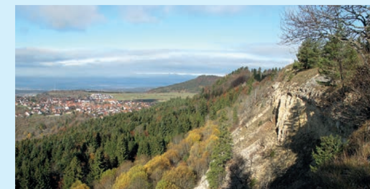
Region der zehn Tausender