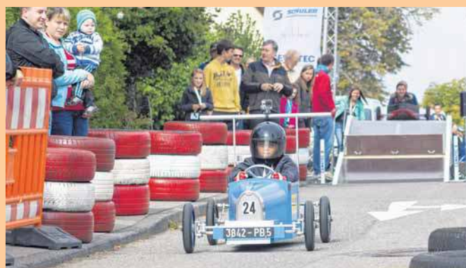
Formel S – wie Seifenkiste. Am Sonntag startet der Große Preis von Gosheim.

Als sportliches Highlight wird bereits zum zweiten Mal nach 2013 der letzte Wertungslauf zur Baden-Württembergischen Seifenkisten-Landesmeisterschaft ausgetragen. Der Firmen- und Azubi-Cup bietet eine exklusive Plattform für Profis aus der Region (Hersteller, Zulieferer, Händler, Ingenieurbüros). Hier sind erstmals auch Fahrzeuge zugelassen, die nicht