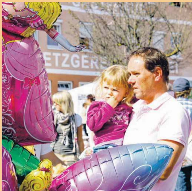
Bummeln mit der ganzen Familie - warum nicht am Sonntag in Gosheim und Wehingen?

und -Einrichtungen locken mit Spezialangeboten