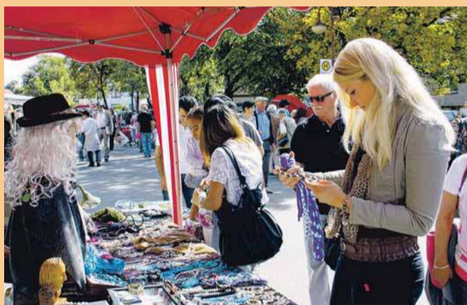
Immer für Entdeckungen gut: Der Heufloma - der Flohmarkt auf dem Heuberg.