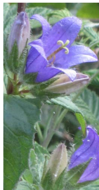
Nesselblättrige Glockenblume, Reichenbach