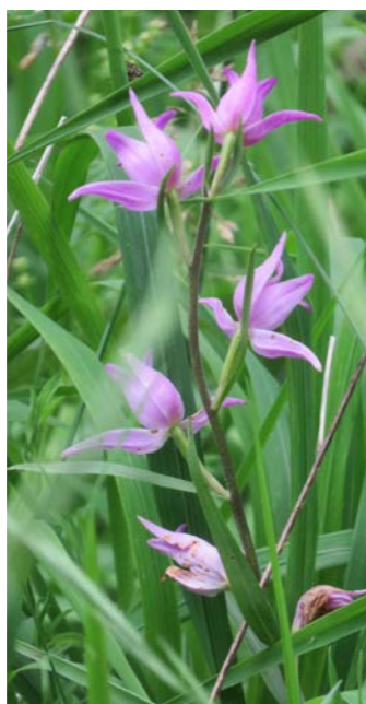
Rotes Waldvögelein, Reichenbach

Betrachten Sie einmal die folgenden Bilder. Eines zeigt das Rote Waldvögelein. Die Einzelblüten erinnern ein wenig an kleine, flatternde Vögel. Ein zweites zeigt die Pfirsichblättrige Glockenblume, ein drittes die Nesselblättrige Glockenblume. Für uns Menschen haben Orchidee und Glockenblumen keinerlei Ähnlichkeit. Aber für ein Insekt sehen ihre Blüten fast gleich aus. Das hat der schwedische Biologe Anders Nilsson herausgefunden.