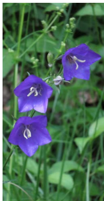
Pfirsichblättrige Glockenblume, Reichenbach