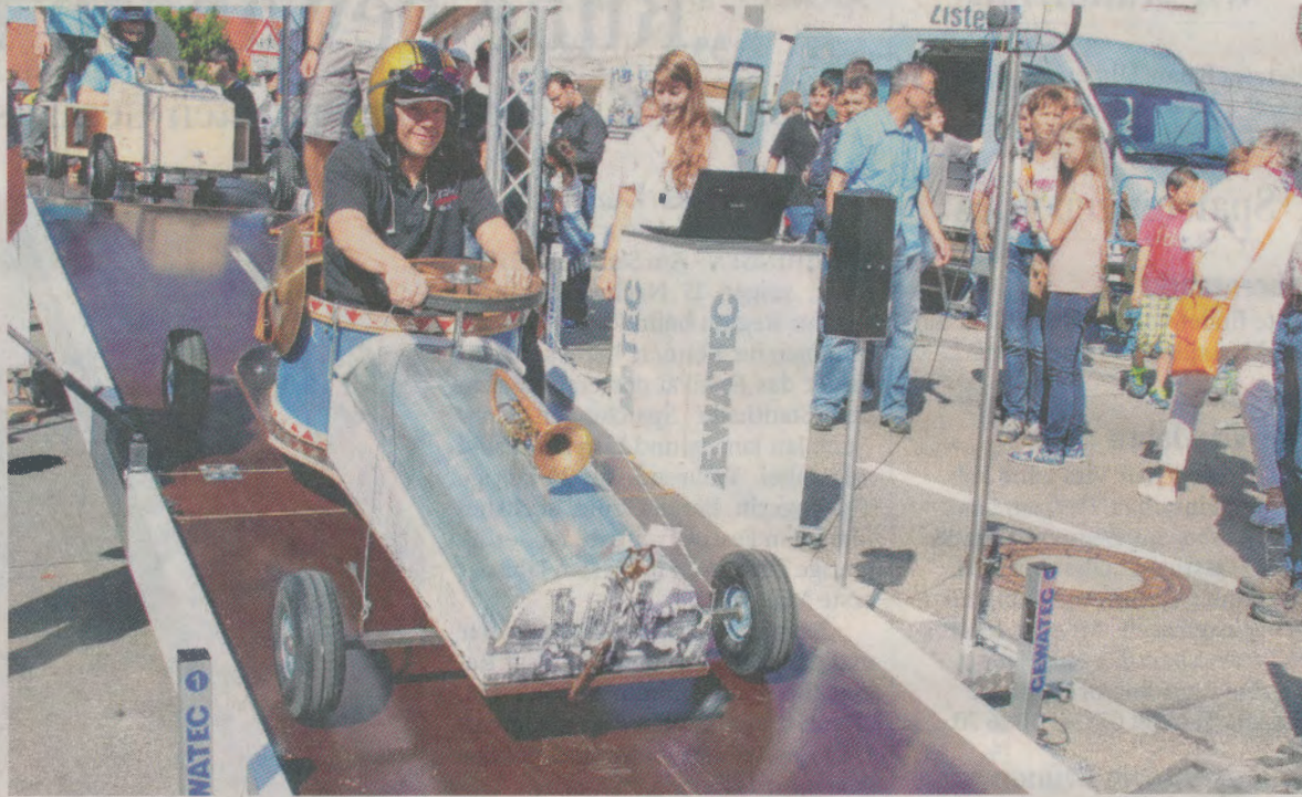
Zur schönsten und ideenreichsten Seifenkiste wurde das Gefährt des Musikvereins von den Zuschauern beim Seifenkistenrennen gekürt.

GOSHEIM – Röhrende Riesenmotoren gegen grazile Leichtgewichte – der Kontrast könnte nicht größer sein. Beim zehnten Gosheimer Seifenkistenrennen anlässlich des verkaufsoffenen Sonntags von „Heuberg aktiv“ hatten die Piloten der selbstgebauten Flitzer PS-starke Konkurrenz bekommen: Während sich die Lembergstraße bis zur Dammstraße in eine Rennstrecke verwandelt hatte, waren auf dem Parkplatz der Hermlé Uhren-Manufaktur die Liebhaber von US-Cars am Staunen und Fachsimpeln. Über 60 lack- und chromblitzende amerikanische Riesenschlitten gaben sich auf Initiative von Ralph Gravenstein