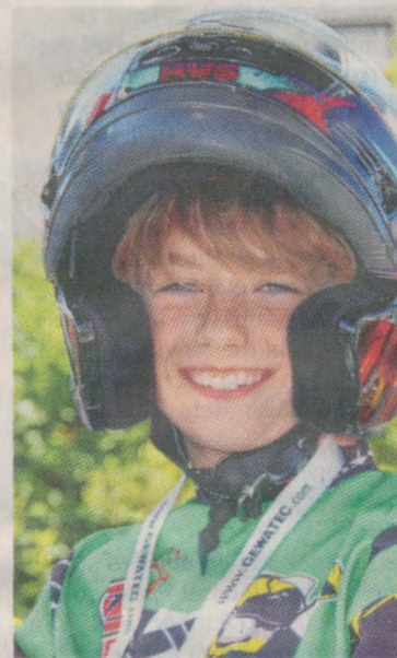
Strahlende Gesichter bei den Piloten.