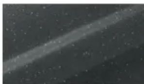
Strukturlack SL 94 Pulverbeschichtung, Metall-Feinstruktur matt (ähnlich DB 703 Feinstruktur)