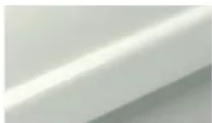
RAL 9016 (Verkehrsweiß) Pulverbeschichtung mit seidenglänzend glatter Oberfläche

Für die Gestellfarbe stehen hochwertige Pulverbeschichtungen und Silber natur zur Wahl: